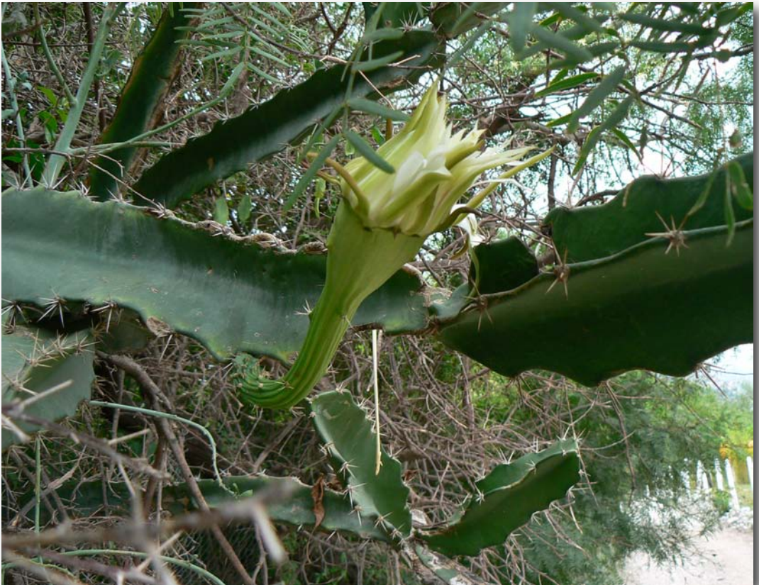
Acanthocereus tetragonus , Cañon de la Huasteca, Nuevo León, Mexico

Ubicación de Los Baxos en “Google Earth”, localidad situada exactamente entre Córdoba y Vera Cruz, como lo había señalado Karwinski.